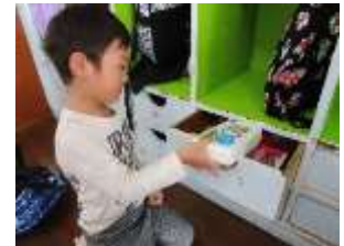
自分の引き出しに片付けます!