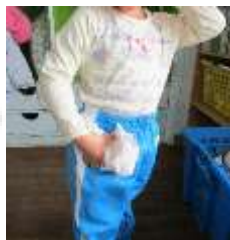
昼食後からスモックを脱ぎ、トレパンへハンカチのお引越し! お昼寝後にまたお着替えます!