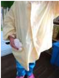
午前中はスモックのポケットにハンカチを入れます。

この1年を通して友達との関わりから相手の思いを知ったり自分の思いを言葉で伝えたりする人間関係。基本的な身支度、身の回りの管理等を繰り返し確認していきながら自分でやっていく姿等…。いろいろなことに挑戦し楽しみながら身につけていくよう丁寧に関わっていきたいと思います。よろしくお願ひ致します!