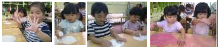
トロトロで気持ちいい～！

片栗粉と水を混ぜて、感触遊びをしました。最初は触る事に躊躇する姿がありましたが、保育者がギュッと握った団子状の片栗粉を子ども達の手に乗せるとトロ～と流れ出す様子にびっくり！そして面白い！！その後は自分でトロトロしたり、ギュッと固めたりして楽しんで遊んでいました。