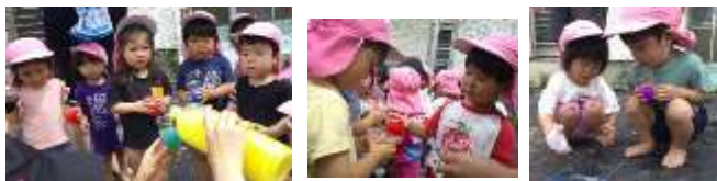
混ぜたら何色かな～？