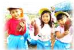
おいしいお芋を使って、またクッキングをしようと思っています～★

片道40分程かけて、サンファームまで歩いて遠足に行ってきました。長い長い道のりでしたが、友達と手を繋いで道路での約束を守りながら歩いて行くことができました。サンファームに着いたらさっそく長靴に履き替えて芋掘り開始！みんな一生懸命に土を掘り始め、芋の頭を発見！しかしここからが大変で、友達と協力して芋が出てくるまで土を掘って掘って・・・やっとのことで抜くことができた時は「やった～やっとなげた～！」と歓喜の声が上がっていました。細いお芋に大きいお芋、みんなで協力してたくさん採ることができました。たくさん動いたあとのお弁当はまたとってもおいしくて、みんなにこにこおいしそうに食べ、帰りに歩くパワーをもらうことができました。おいしいお弁当の用意ありがとうございました。