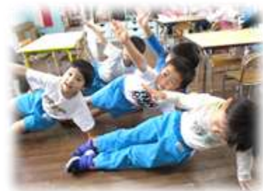
見て見て！組体操できたよ～！！

運動会では、お家の方に“かっこいいところを見てもらいたい”という気持ちを持って参加した子ども達、カラーガードでは元気に声を出してクラスのみんなで気持ちを一つにとってもかっこよく披露することができました。かけっこ、リレーでは一生懸命に走りぬくことができ、頑張れ！と友達を応援する姿がありました。玉入れでは異年齢の友達と協力したり応援し合ったりして前よりもっと絆が深まったようでした。運動会での経験を通して、子ども達それぞれがまた一つ大きく成長することができたのではないかと思います。また、きりん組さんの鼓隊を見て「大太鼓やってみたい」と話していたり、友達と組体操をやってみたり・・・“来年は自分達が♥”と憧れの気持ちも持つことができたようです。