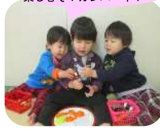
楽しむぞ！カンパニー！