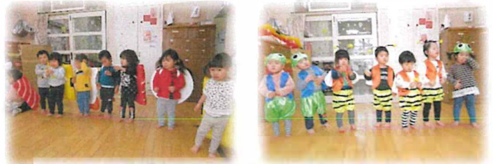
衣装チェンジしてみたよ♪