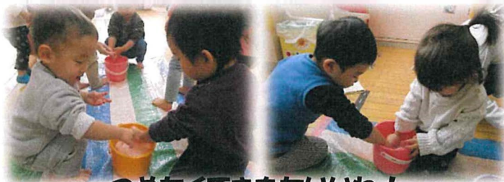
つめたくてきもちいいね！

「つめた〜い♡」と言いながらも、手で雪を握ったり、頬につけたりと楽しんでいました♪また、小さな雪だるまを保育士に作ってもらおうと大事そうに持って喜んでいました。雪が園庭に沢山積もったら雪遊びをたっぷり楽しみたいと思います！