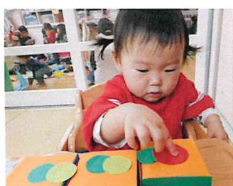
はらぺこ あおむし☆

11月10日の作品展に向けて作品作りをしています。「果物列車」をテーマにし、りんごやぶどうなどの様々な秋の果物を作っています。サインペンでお絵描きをしたり、シール貼りをしたり、初めてのタンポ（スタンプ）にも挑戦しました。保育士と一緒にやってみるとすぐにやり方を覚え、「ポンポン」と腕を上下させて紙に絵の具を付けていました。もう一つの「手作り積木」には、大好きなはらぺこあおむしを両面テープで貼りました。細かい目や角は指にくっついてなかなか貼れず…。苦戦しながらも「ぺたっ！」と楽しみながら貼りました。可愛い作品が着々と出来上がってきています。ぜひ、楽しみにしててください☆